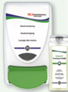
Estesol® PREMIUM PURE