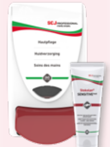
Stokolan® SENSITIVE PURE