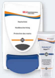
Stokoderm® AQUA PURE